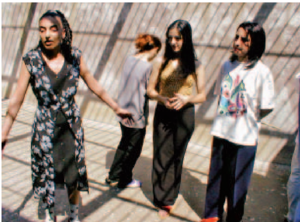
Kvinnelige innsatte.