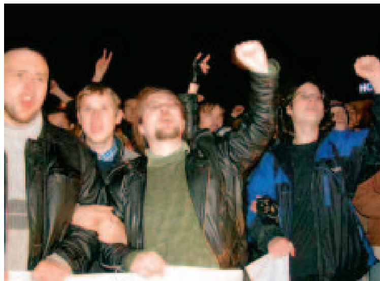
Fra opptøyene 19. oktober