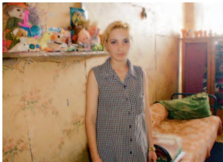
De innsatte i armenske fengsler lever under dårlige forhold og mange av de er meget unge. Denne jenta har pyntet cellens eneste hylle med dukker og bamser.