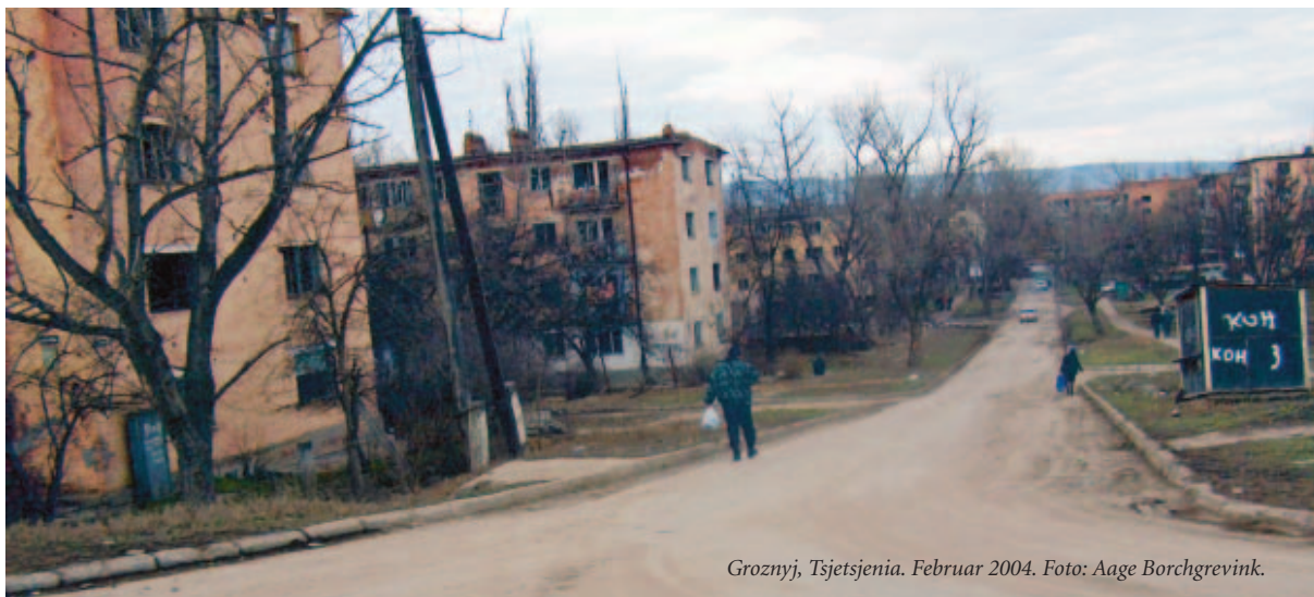
Groznyj, Tsjetsjenia. Februar 2004.

I september utga Helsingforskomiteen og Helsingforsføderasjonen rapporten "The Silencing of Human Rights Defenders in Chechnya and Ingushetia" (Report 1/2004). Rapporten dokumenterer 141 enkelttilfeller av trakassering, forfølgelse og "forsvinninger" av lokale og internasjonale menneskerettighetsaktivister. De ansvarlige er i all hovedsak føderale (russiske) styrker.