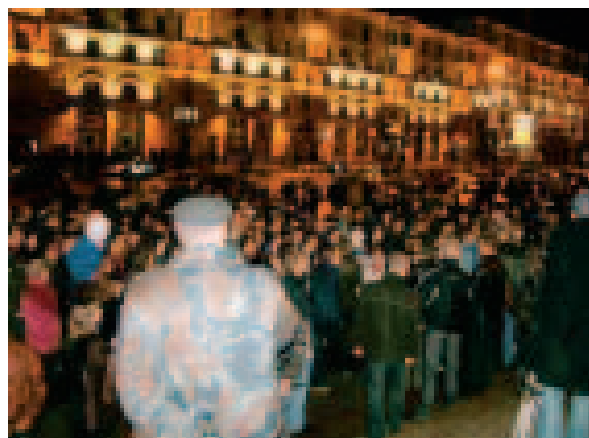
Opptøyer i Minsk 19. oktober 2004 da folk demonstrerte mot valgfusk.