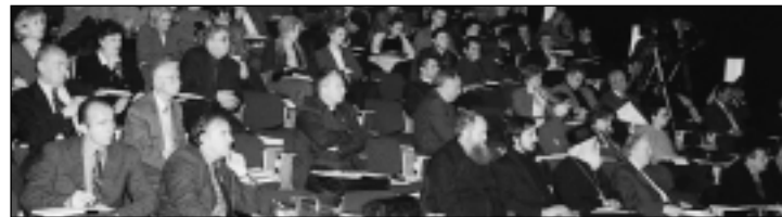
Konferansene om forsoning hadde stor deltakelse. Her fra Montenegro.