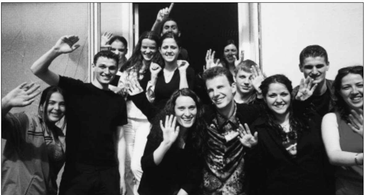
Ungdommer fra Kosovo på menneskerettighetsskole.