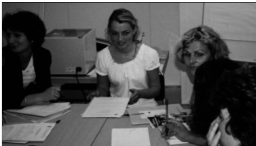
Lørdag 7 april arrangerte Helsingforskomiteen et seminar med flyktningkvinner fra Kosovo. På agendaen sto informasjon om kvinners situasjon i Kosovo og kvinners menneskerettigheter. Målsettingen var å motivere kvinnene til å drive menneskerettighetsarbeid i Kosovo etter tilbakevendning.

Etter at rundt 6000 flyktninger fra Kosovo kom til Norge i 1999, startet Helsingforskomiteen Kosovo-prosjektet, med finansiell støtte fra Utlendingsdirektoratet. Prosjektets formål har vært å forberede flyktningene til å bidra til å bygge et demokratisk samfunn i Kosovo etter returen fra Norge. Tilbakevendning er et stort skritt for den det gjelder. Kosovo er i dag et samfunn som er preget av hat, nasjonalisme og splittelse. Overgangen til fred og demokrati er derfor en vanskelig prosess. Helsingforskomiteen har ønsket, ved å gi opplæring i menneskerettigheter og flerkulturell forståelse, å skape en positiv beredskap hos flyktningene slik at de kan bidra til å bygge et fredelig multietnisk samfunn når de kommer tilbake. Vi har også villet informere dem om situasjonen i Kosovo og hva som venter dem i hjemlandet. Hundrevis av flyktninger har hatt nytte av prosjektets aktiviteter gjennom informasjon og opplæring. Prosjektet ble avsluttet høsten 2001.